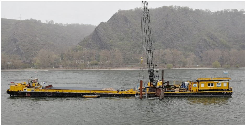
Abbildung: Baustelle Nr. 7 bei Hirzenach, die Prüfplatte wird gerade unter Wasser montiert

Die Prüfplatten dienen dabei vor und nach einer Messfahrt als Referenzgrund für die Überprüfung des Messsystems an Bord der Peilschiffe. Anhand der von den Peilschiffen über der Prüfplatte vorgenommenen Tiefenmessung können die bordeigenen Instrumente kontrolliert und ggf. nachkalibriert werden. Dadurch wird eine optimierte Datenerfassung erreicht und eine höhere Datenqualität erzielt.