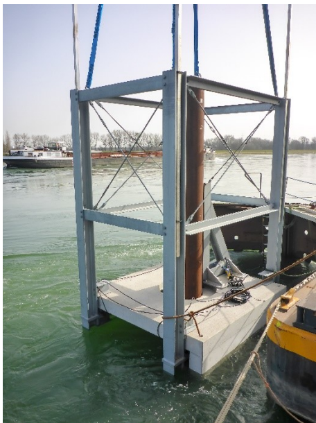
Abbildung: Einbau einer Prüfplatte

Der Neubau von zehn Prüfplatten im Rhein zwischen Maxau und Bonn konnte Ende April 2021 erfolgreich abgeschlossen werden. Die Bauarbeiten verliefen an allen Standorten reibungslos und konnten innerhalb des vorgesehenen Zeitraums beendet werden.