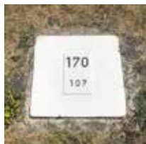
Buhnenstein der Buhne Nr. 170 mit einer Länge von 107 m

Zur Kennzeichnung der Buhnen befindet sich am Ufer ein weißer Buhnenstein.